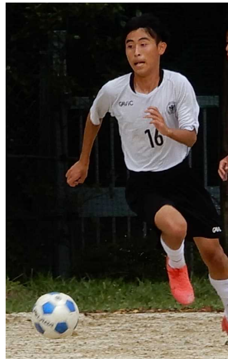
頑張る高校サッカー部を応援しよう！